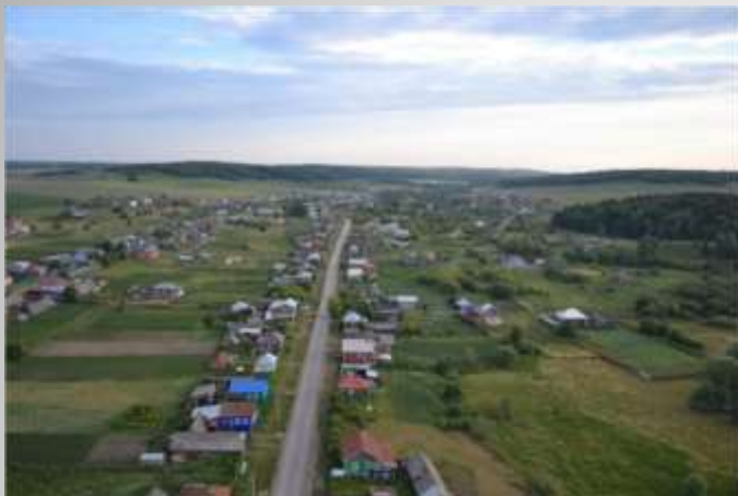
Арткы фонда: Уен тау