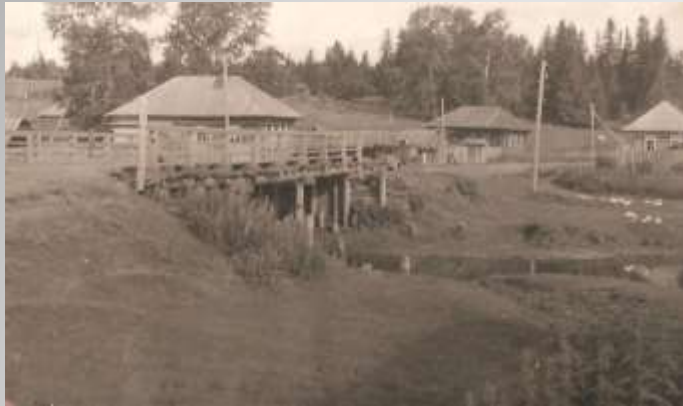
Чириз елгасы аша салынган күпер. 1964 ел