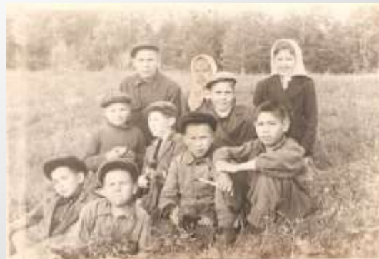
Каенавыл балалары һәм авыл күрөнешө. 1950нчө еллар башы