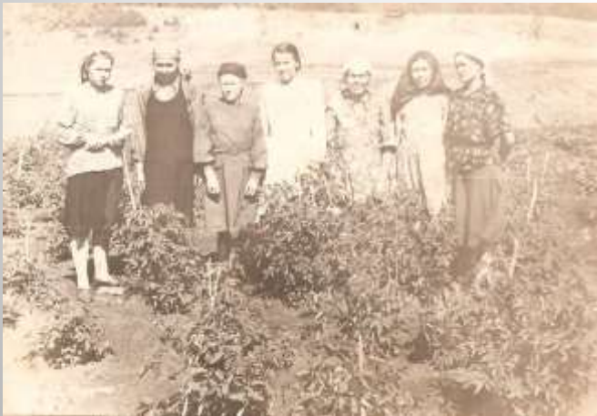
Кантуган чишмә буендагы помидор түтәлләре янында. 1950нче еллар башы

Кантуган чишмә суы авыруларны савыктыра, хәлләрен җиңеләйтә, ди авылның аксакаллары. “Сугышка китәр алдыннан егетләр, чишмә янына килеп, аның белән сабуллашалар иде”, дип искә ала авылдашыбыз Татарстанның атказанган сәнгать эшлеклесе, композитор Мәсгут абый Имашев. Хәзер дә чәйгә дип күп кенә авылдашларыбыз чишмәдән су ташый. Күтәрәп күп алып кайтып булмаганга я җиңел машинада, я мотоциклда, я велосипедта баралар күбесе.