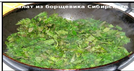
Борщевик сибирский – «Борщ пикан».

4) Очень вкусны молодые отварные листья этого растения со сметаной. Коми-пермяки считают его самым полезным витаминным весенним растением. Один из видов пиканов. О каком растении идет речь?